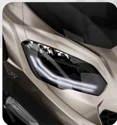
FULL LED ΦΩΤΙΣΜΟΣ