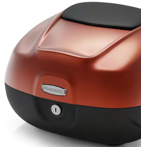
ΒΑΛΙΤΣΑΚΙ 37 I