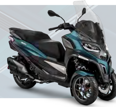
BLU OXYGEN MATT