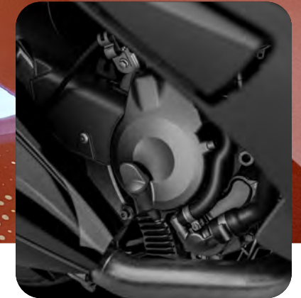
ΚΙΝΗΤΗΡΑΣ 400 CC EURO 5