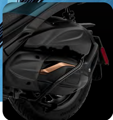
ΝΕΟΣ ΚΙΝΗΤΗΡΑΣ 530 CC EURO 5