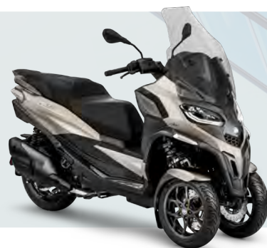
GRIGIO CLOUD MATT