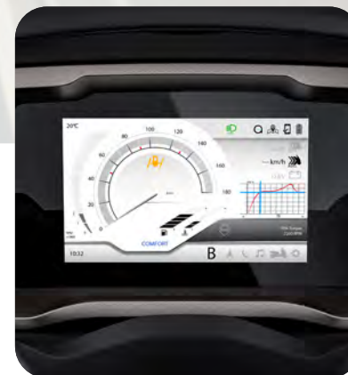
ΠΙΝΑΚΑΣ ΟΡΓΑΝΩΝ ΜΕ ΨΗΦΙΑΚΗ ΟΘΟΝΗ TFT 7"