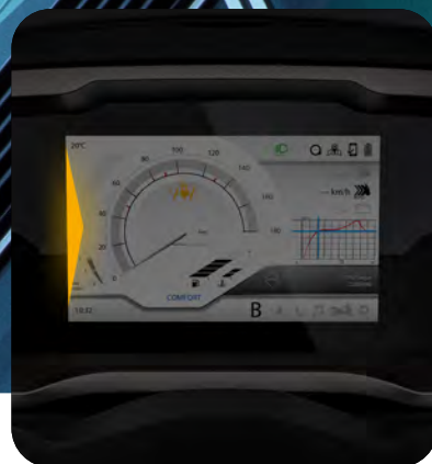
ΣΥΣΤΗΜΑ ΠΛΗΡΟΦΟΡΗΣΗΣ ΤΥΦΛΟΥ ΣΗΜΕΙΟΥ