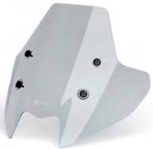
ΠΑΡΜΠΡΙΖ SPORT ΜΑΥΡΟ