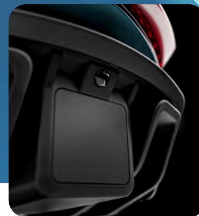
ΛΕΙΤΟΥΡΓΙΑ ΟΠΙΣΘΕΝ ΜΕ ΚΑΜΕΡΑ ΟΠΙΣΘΟΠΟΡΕΙΑΣ