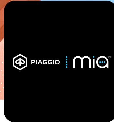
ΠΡΟΗΓΜΕΝΗ ΣΥΝΔΕΣΙΜΟΤΗΤΑ ΜΕ ΤΟ ΡΙΑΓΓΙΟ ΜΙΑ