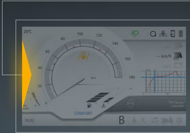
BLIS - ΣΥΣΤΗΜΑ ΠΛΗΡΟΦΟΡΗΣΗΣ ΤΥΦΛΟΥ ΣΗΜΕΙΟΥ