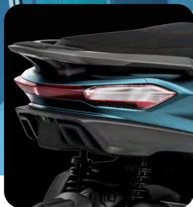
ΝΕΑ ΣΧΕΔΙΑΣΗ ΜΕ ΥΠΕΡΣΥΓΧΡΟΝΕΣ ΓΡΑΜΜΕΣ