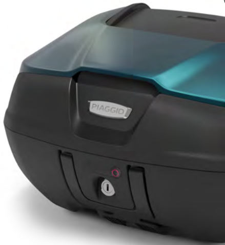
ΒΑΛΙΤΣΑΚΙ 52 I