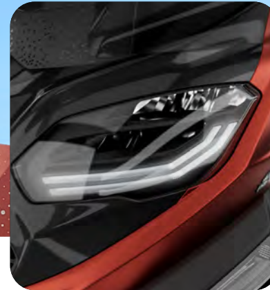
ΝΕΟΙ ΠΡΟΒΟΛΕΙΣ ΜΕ LED ΦΩΤΑ ΗΜΕΡΑΣ