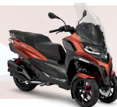
ARANCIO SUNSET MATT