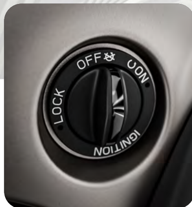
ΝΕΟ KEYLESS ΣΥΣΤΗΜΑ