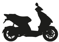
ΜΑΥΡΟ ΜΑΤ "ΜΕΤΕΟΡΑ"