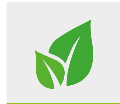
ΝΕΟΣ ΚΙΝΗΤΗΡΑΣ 50cc 2-ΧΡΟΝΟΣ, ΥΓΡΟΨΥΚΤΟΣ, ΜΕ ΗΛΕΚΤΡΟΝΙΚΟ ΚΑΡΜΠΥΡΑΤΕΡ, EURO 4