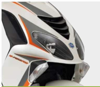
ΝΕΑ ΣΠΟΡ ΓΡΑΦΙΚΑ