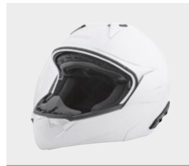
ΜΕΓΑΛΟΣ ΑΠΟΘΗΚΕΥΤΙΚΟΣ ΧΩΡΟΣ ΚΑΤΩ ΑΠΟ ΤΗ ΣΕΛΑ, ΙΚΑΝΟΣ ΝΑ ΦΙΛΟΞΕΝΗΣΕΙ ΕΝΑ ΚΡΑΝΟΣ FULL-FACE