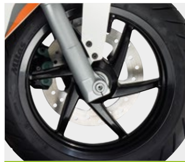
ΜΕΓΑΛΥΤΕΡΟ ΜΠΡΟΣΤΙΝΟ ΔΙΣΚΟΦΡΕΝΟ