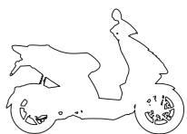
ΛΕΥΚΟ ΠΑΣΤΕΛ "LUNA"