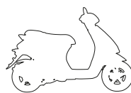
ΛΕΥΚΟ ΠΑΣΤΕΛ "ΟΤΤΙΣΟ"