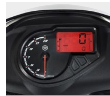
ΝΕΟ ΤΑΜΠΛΟ ΜΕ ΑΝΑΛΟΓΙΚΑ ΚΑΙ ΨΗΦΙΑΚΑ ΟΡΓΑΝΑ